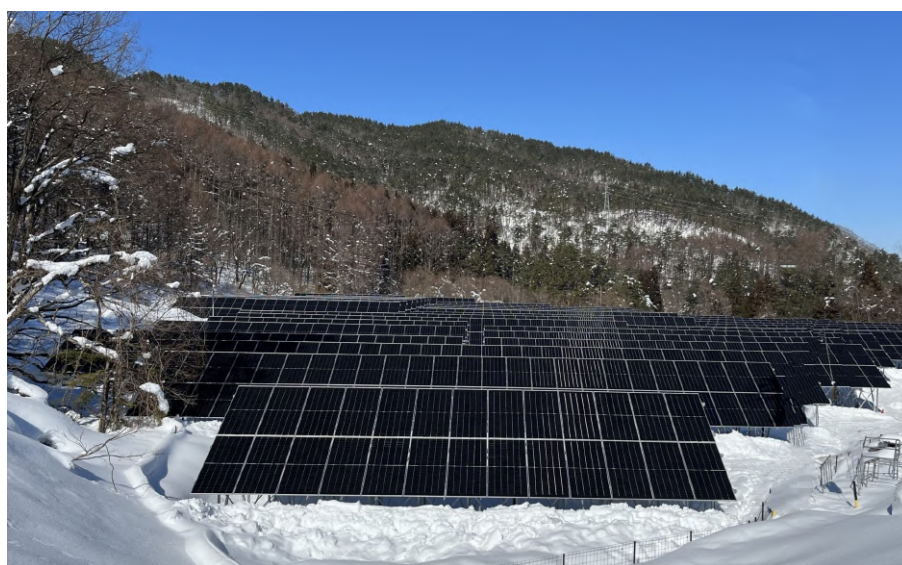
▲コーポレートPPA先の一つ長野県田上市の太陽光発電所（発電事業者：スマートブルー株式会社）